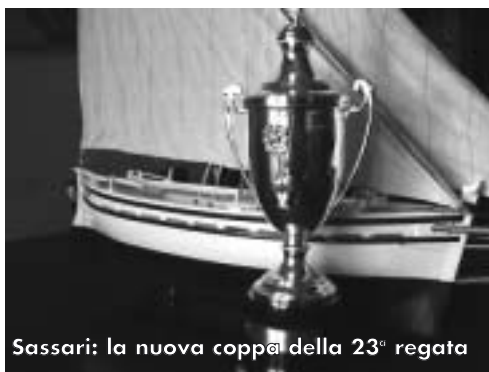
Sassari: la nuova coppa della 23ª regata