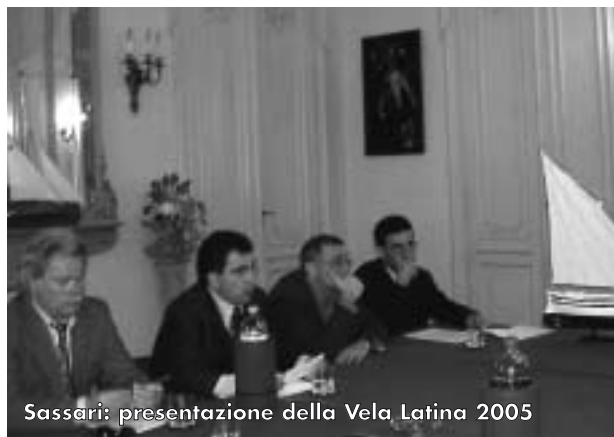
Sassari: presentazione della Vela Latina 2005

Due storiche manifestazioni che hanno saputo integrarsi e coordinarsi, mettendosi insieme e dando vita ad un agosto particolarmente interessante ed