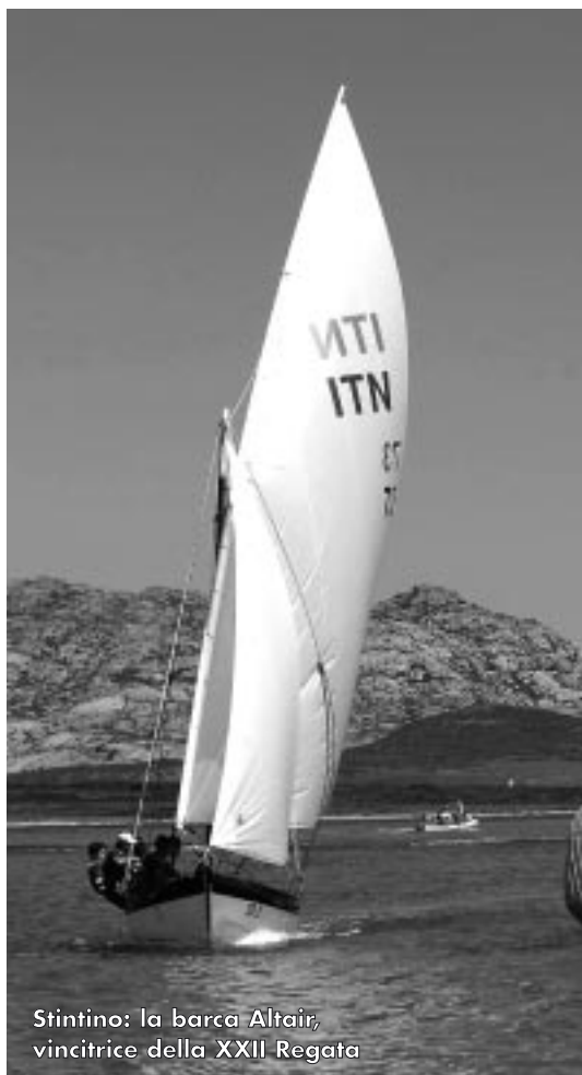
Stintino: la barca Altair, vincitrice della XXII Regata

Una concomitanza delle date che non apportava alcun beneficio in termini di attenzione e presenza turistica. Anzi. Quest'anno il secondo campionato organizzato dalla Federazione Italiana della vela non si svolgerà più a Stintino, ma a Carloforte e anche la data è stata spostata: si regaterà ai primi di luglio. ■